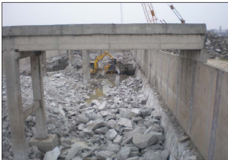
Demolarea podurilor bazinelor de aerare

Recent a fost încheiată demolarea podurilor aferente bazinelor de aerare de la Linia 1, conform propunerii constructorului privind consolidarea acestor bazine. Lucrările de demolare la Linia 2 sunt în derulare.