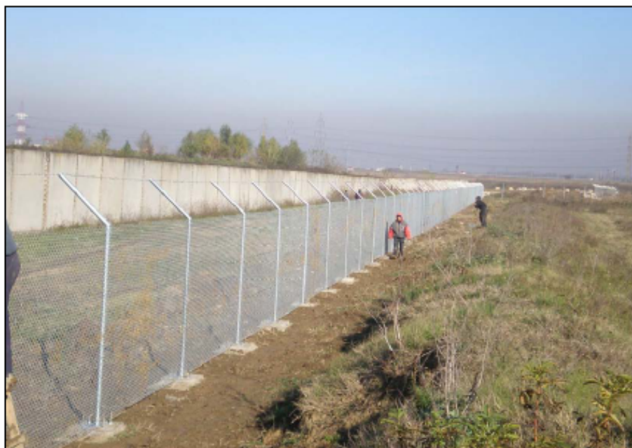
Gardul care împrejmuește Stația

Așa cum am precizat în buletinul informativ anterior, construcția gardului ce împrejmuește șantierul a fost finalizată încă din decembrie anul trecut.