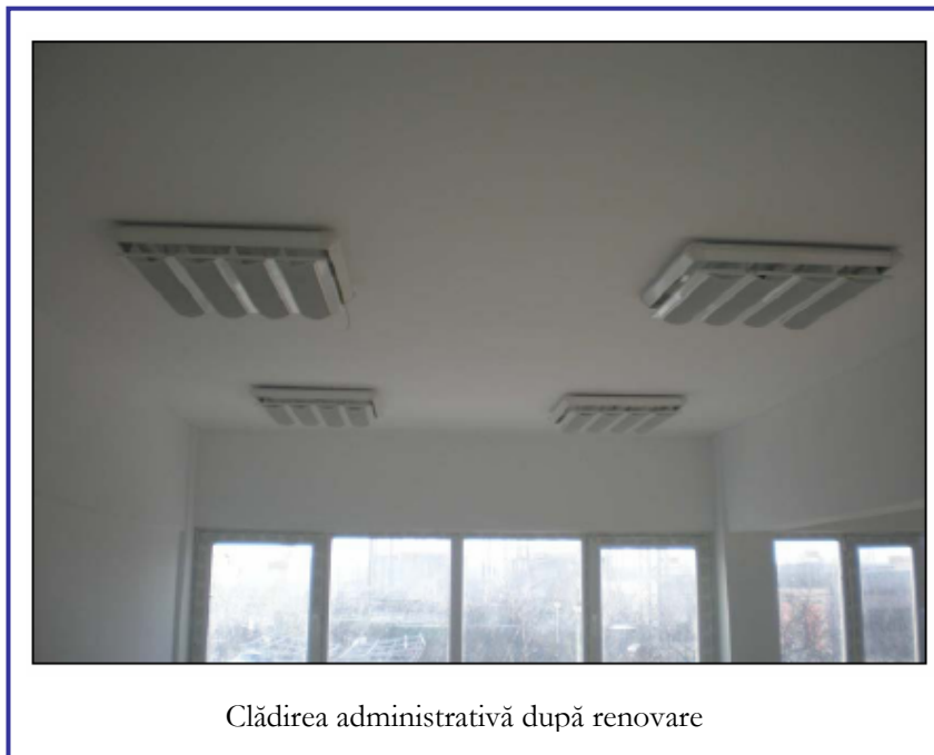
Clădirea administrativă după renovare

Lucrarile de reabilitare a cladirilor din incinta statiei continua cu hidroizolatiile planseelor de la cabina de poarta, de la atelierul mecanic , precum si inlocuirea tamplariei cladirii ce adaposteste spalatoria si grupurile sanitare