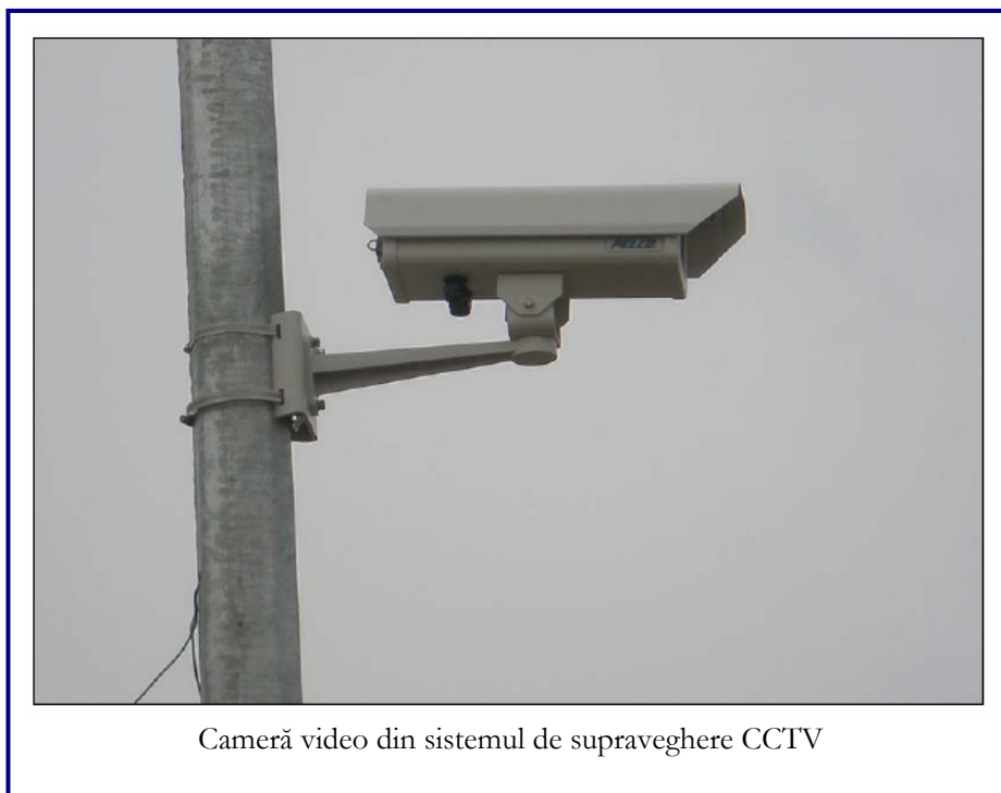
Camera video din sistemul de supraveghere CCTV

Pentru asigurarea unei bune securități a viitoarei stații de epurare, a fost finalizat sistemul de iluminat perimetral și, de asemenea, au fost instalate camere de luat vederi cu circuit închis.